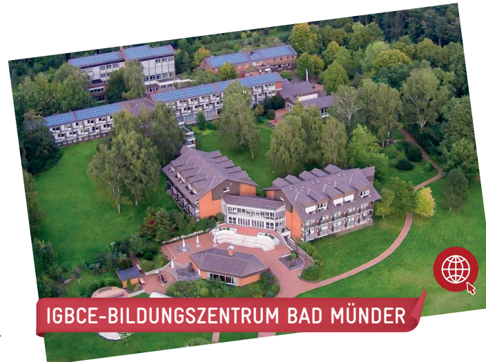
IGBCE-BILDUNGSZENTRUM BAD MÜNDERS